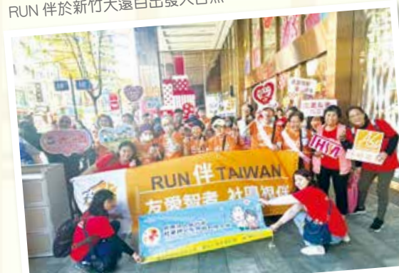
RUN 伴於新竹大遠百出發大合照

社福與長照的工作，往往是「付出不一定立刻看見成果」的行業。長年深耕的努力終於獲得肯定——新竹社會服務中心榮獲 2024 年新竹市績優長照機構，共摘得 3 座團體獎與 6 座個人獎，成為全市獲獎最多的長照單位。代理市長邱臣遠親自頒獎，肯定我們以行動落實長照精神，提供優質貼心的服務。