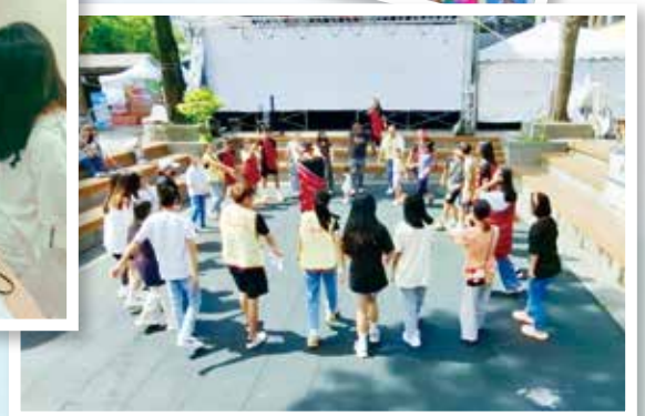
竹東原住民社區親子活動