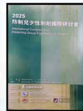
2025 防止兒少性剝削國際研討會