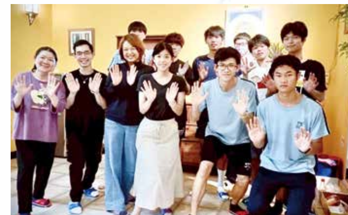
徐匯愛很簡單課程