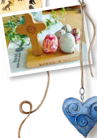
2025 年「復活節手作靈修」工作坊：參與者從縫製復活蛋中默觀基督的復活