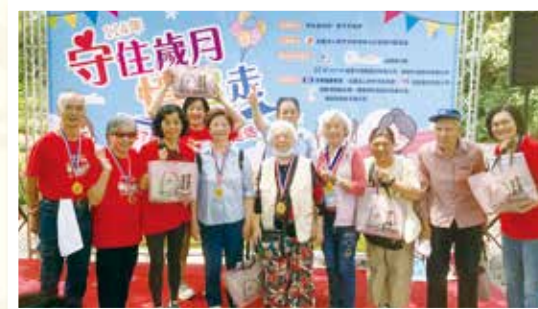
獨居長者及志工完賽歡喜合照

此外，2024 年 11 月 23 日首次舉辦新竹市「RUN 伴健走——以陪伴傳遞愛與友善」，RUN 伴 (RUN TOMO) 源自日本認知症協會，倡導失智者與社區民眾共同健走、促進理解與交流。長輩們精神奕奕、笑容滿面，沿途獲得熱情鼓勵，展現生命力，也凝聚了社區的溫暖支持。