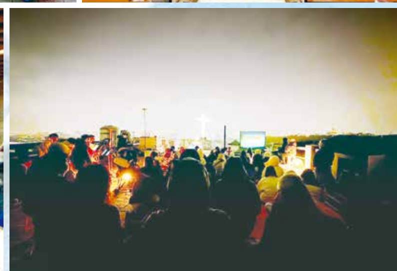
天主教青年週戶外音樂祈禱

朝向基督的同一顆心： 每一天的彌撒、每一次的分享，一起的相處共融，走朝聖的旅程……深刻地感受「我們來自同一個身體」，每個人都像是一本與主一起寫下的美麗書籍，雖然短短時間來不及好好細讀，卻足以打破了對彼此的陌生和未知，盼望將來再相遇！我會珍藏這其中的美妙，親自體會才能感動的——「不同背景的我們，因著共同的雙語言（華語、信仰），流動著相同的氣息」！信仰發展在各地雖有不同困難和挑戰，然而看見聖神的工作從未停歇，或輕忽任何人的渴望與需要。天主藉教會的共融，深感體會：無論地上有多少分裂阻礙，在上方垂顧我們的是同一片天空；身旁環抱我們的是同一片海洋；心中看顧我們的，是朝向基督的同一顆心。