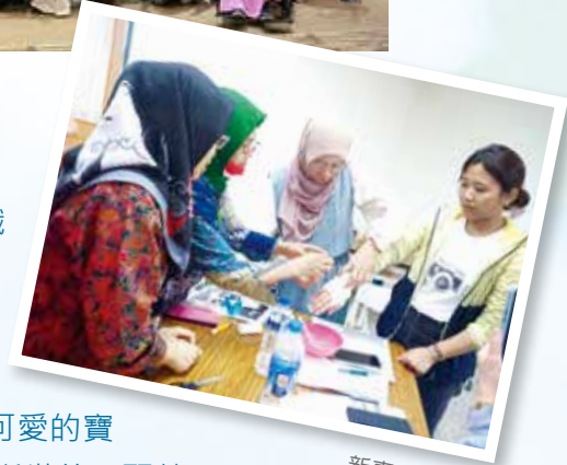
新事移工照顧服務訓練