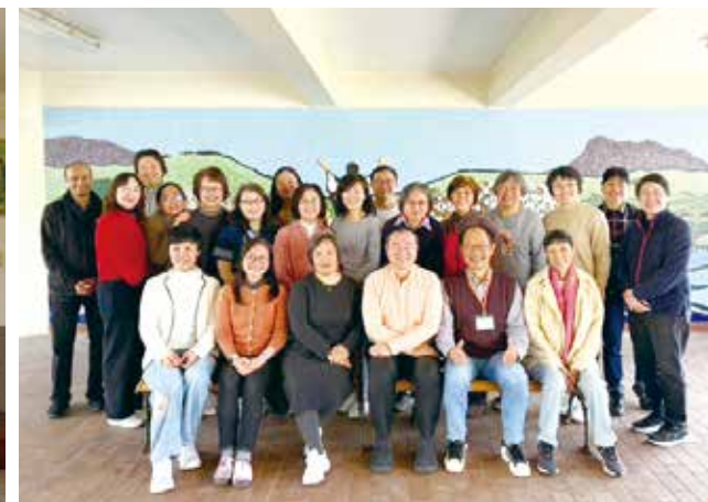
2025 年「兩岸四地靈修輔導員培育」活動： 跨地域靈修輔導員共融與分辨