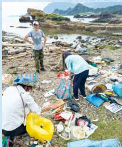
基隆輔大聖心學生淨灘