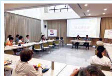
聘僱外籍看護工家庭：雇主座談