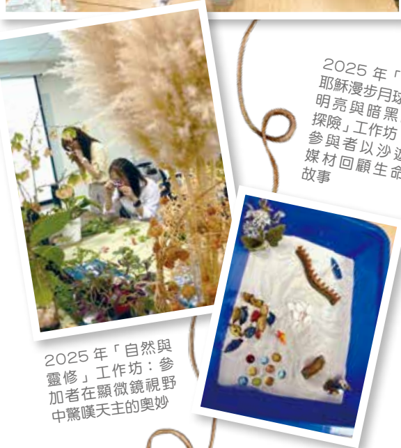
2025 年「自然與靈修」工作坊：參加者在顯微鏡視野中驚嘆天主的奧妙