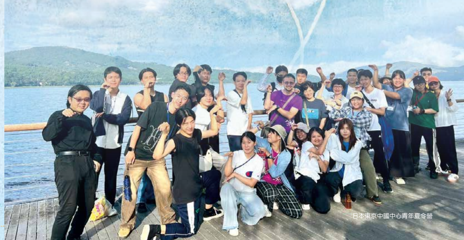
日本東京中國中心青年夏令營

隨著耶穌會中華省使徒計畫正在進行牧靈規劃的旅程，我們將回到每個青年工作者被召喚來到天主的園地，成為青年使命合作者的初衷。探尋、反思我們曾走過光明恩寵、幽暗陰影的歷史，積極面對真實的現況與這個世代青年的樣貌與渴望，隨同聖神的帶領，共同分辨、彼此修和。與天主、與夥伴、與青年同行，朝向天主指引的充滿希望的未來前行。