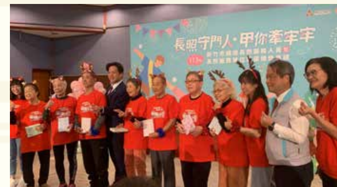
張女士之母親（左 3）於長照表揚活動中演出