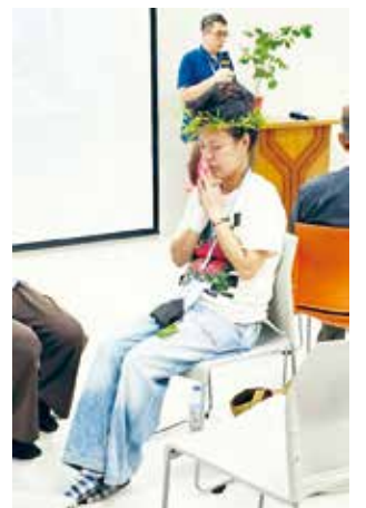
2025 年「自然有祿」工作坊： 恩人們在默觀中沉浸於上主的創造