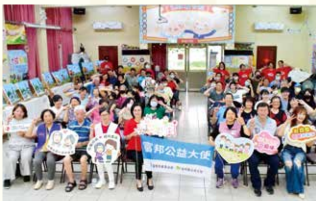
樂齡藝術村成果展開幕式

長照服務除了既定的照顧計畫與定期訪視外，團隊同時關注服務對象的心情與家庭需求，並積極串連內外部資源，提供物資、輔具、心理輔導與節慶年菜等全方位支持。秋霖園亦提供沐浴、居家照顧、假日喘息與夜間住宿服務，讓家庭照顧者獲得休息，人力與空間配置均高於法定標準，確保照顧品質與安全。在弱勢家庭服務上，我們強調每位成員的獨特價值與潛能，透過一對一陪伴與家庭培力，減少抗拒、強化連結，陪伴那些被忽視或尚未被看見的族群，讓每一份需要都被理解與接納。2024 年共服務 2,237 人、75,559 人次；2025 年 1 至 9 月已服務 2,091 人、51,032 人次，雖然數字無法完全詮釋服務的深度及意義，卻見證越來越多弱勢家庭因專業介入而獲得實質改變。