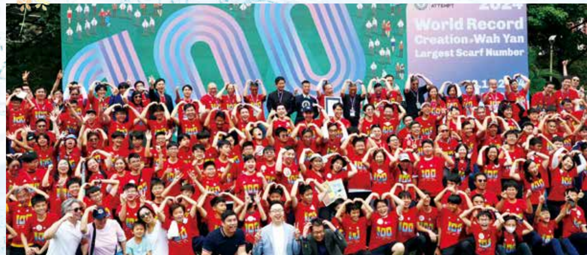
九龍華仁書院的百周年校慶以破健力士世界紀錄慈善活動揭開序幕。

2024-25 學年，九龍華仁書院迎來創校 100 周年。作為一間耶穌會男校，在此百周年內，在任何一個慶祝活動中最常被提及的，卻是一個「情」字。