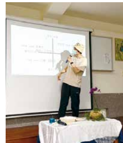
2025 年校友培育工作坊合影： 校友積極參與討論以整合理論與實務經驗