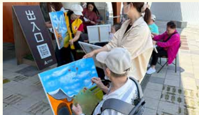
許先生之父親於南寮漁港戶外寫生