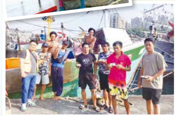
新事送中秋月餅給漁工們