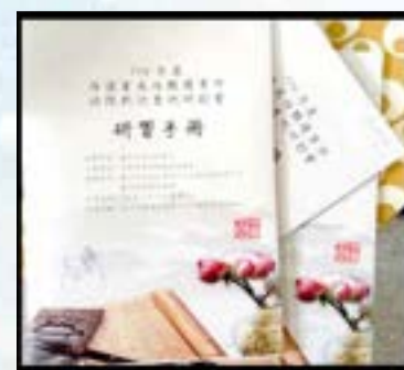
性侵害或性騷擾事件法院判決案例研討會