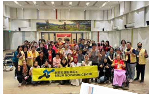
移工雇主星光大道