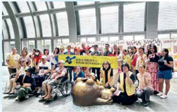
第六屆台北國際移工禪繞畫展：移工的交織與歸屬