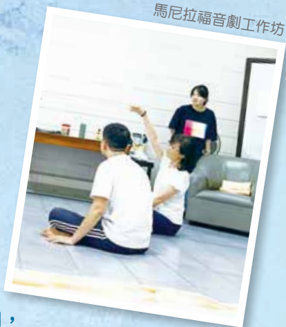
馬尼拉福音劇工作坊