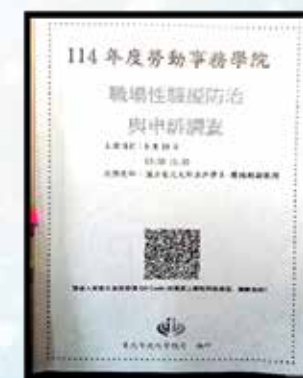
勞動部職場霸凌性騷擾防治講座