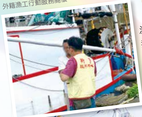
外籍漁工行動服務關懷