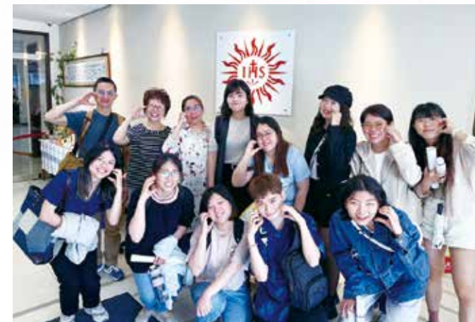
2025 年台北市立大學繪畫工作坊師生合影： 參加者體驗如何透過藝術表達信仰