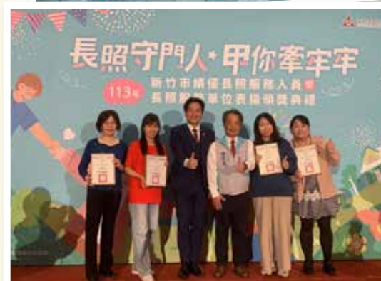
左 2 為新竹社服中心得獎代表

未來，我們將持續秉持杜華神父的「傻瓜精神」，深入社區，推動多元、連續性的專業服務，從長照、社福到家庭扶助，落實全人關懷。誠摯邀請社會各界成為「杜華之友」，透過捐款、物資或志工行動，一同惜老扶弱，讓善的力量持續擴散，杜華社福的愛與行動，能成為社區中最踏實、最溫暖的力量。