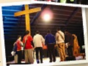
在世青十字聖祭前 團體祈禱

所以儘管嘲笑我吧，我能做的很渺小，但這所代表的意義有多重大，我想我知道。“You will receive power when the Holy Spirit has come upon you; and you will be my witnesses.” 我有幸能夠認識這個世界真正的模樣並進而體會生命。而這篇文章，就是我的見證。