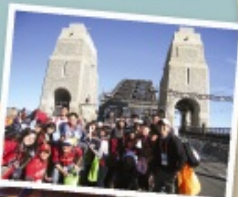
MAGIS進香團 攻佔雪梨大橋