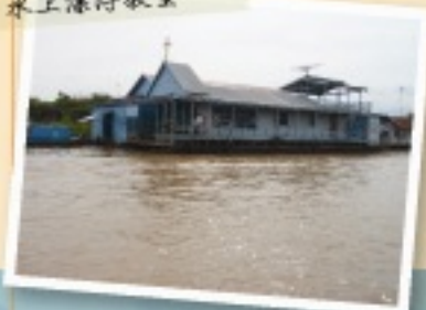
位於柬埔寨暹粒的 水上漂得教堂

改變的契機在於「水上人家」——那是我們對無數的柬埔寨人民搭建於此的杆欄式建築、在一個廣大湖泊上所形成的村落的暱稱，捕魚、盥洗、飲水、排泄、嬉戲皆於此，一生都與這座湖脫不了關係。透過一個個燦爛笑容少女的擺渡來回，我們清楚看到生老病死，貧窮與飢渴。憂愁與掙扎在我心中百轉千迴，一個個在教堂裡青澀天真的孩子們嬉鬧的模樣看起來又是如此幸福無憂，然而這是一個幼童死亡率高達一成的國家，一個地雷、雛妓、人口販賣與毒品問題叢生的地方。我彷彿可以預見天使們折翼的那一瞬間，